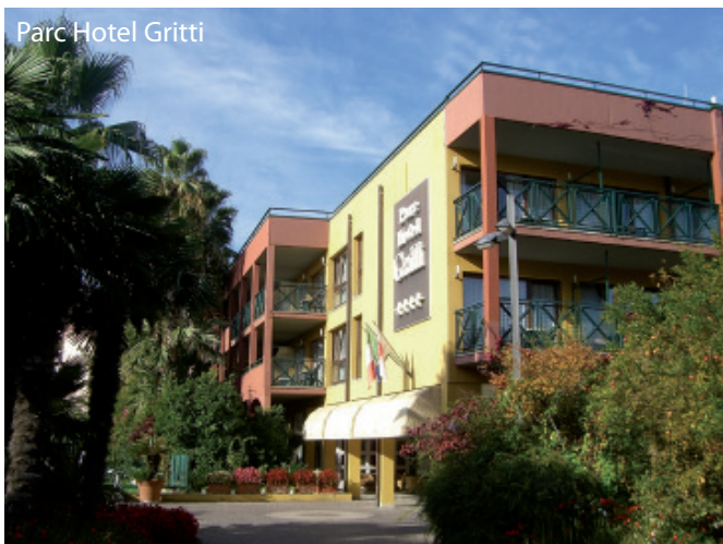
Parc Hotel Gritti

Dank des leichten spritzigen Rotweins ist das kleine Städtchen Bardolino in aller Munde. Die Altstadt mit Ihren breiten Gassen und zahlreichen Geschäften sowie eine lange Uferpromenade laden zum Bummeln ein. Hier geht es bis in die späten Abendstunden lebhaft zu. Landeinwärts von Bardolino liegen inmitten malerischer Weinberge und Olivenhaine zahlreiche Weingüter und Ölmühlen, die ihre Erzeugnisse anbieten. Der Gardasee hat zu allen Zeiten fasziniert, was den Beweis für seine unvergängliche Schönheit darstellt.