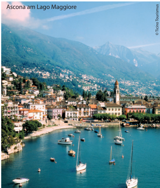
Ascona am Lago Maggiore

In einer schönen und ruhigen Lage, mitten in einem Park ist das Hotel Mulino nur wenige Schritte vom Lago Maggiore und vom Herzen Asconas entfernt. Ascona ist eines der beliebtesten und exklusivsten Ferienzele der Schweiz. Das verzweigte Netz der Gassen, in denen Geschäfte aller Art zu finden sind, führt direkt zur Piazza am Seeufer. Hier genießt man einen wunderbaren Ausblick auf den Lago Maggiore.