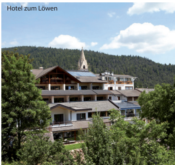
Hotel zum Löwen

07.00h Basel-Sargans-Davos-Flüelapass-Zernez-Ofenpass - Müstair - Meran - Molten