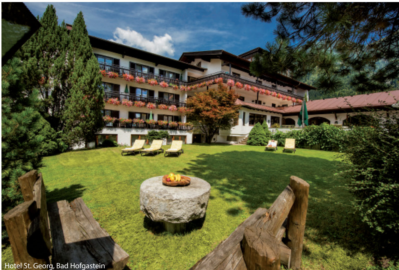
Hotel St. Georg, Bad Hofgastein

Das gediegene Johannesbad Hotel St. Georg befindet sich im Herzen von Bad Hofgastein. Hier geniessen Sie ein exklusives Ambiente. Erholungsmomente versprechen der Wellnessbereich mit Innenpool und Fitnesscenter sowie Sauna, Dampfbad und ein Whirlpool. Gönnen Sie sich eine der zahlreichen angebotenen Wellness- und Schönheitsanwendungen. Im Restaurant werden Ihnen österreichische und internationale Küche sowie Salzburger Spezialitäten serviert.