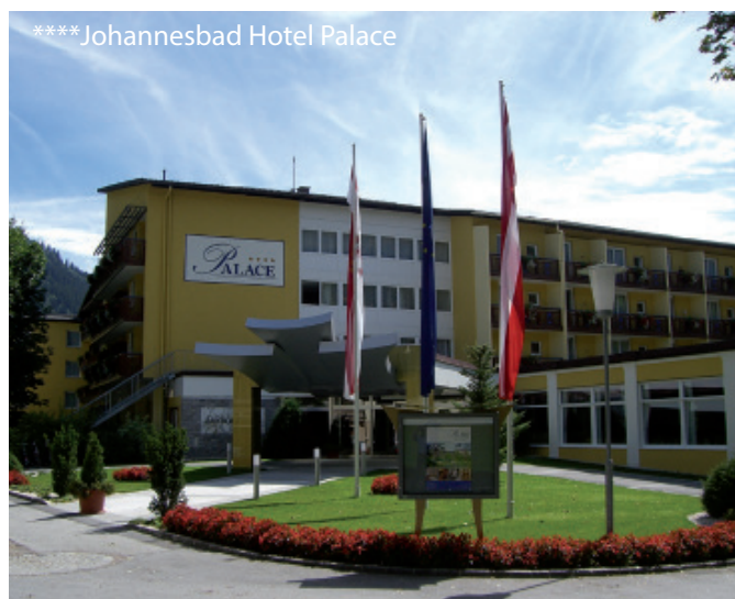
**** Johannesbad Hotel Palace

Sonntag, 22. - Sonntag, 29. Juli 2018 / 8 Tage