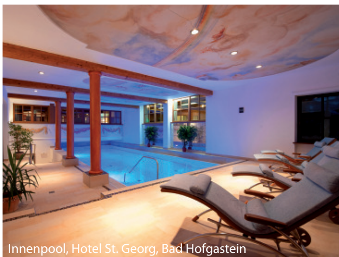
Innenpool, Hotel St. Georg, Bad Hofgastein

Das gediegene Johannesbad Hotel St. Georg befindet sich im Herzen von Bad Hofgastein. Hier geniessen Sie ein exklusives Ambiente. Erholungsmomente versprechen der Wellnessbereich mit Innenpool und Fitnesscenter sowie Sauna, Dampfbad und ein Whirlpool. Gönnen Sie sich eine der zahlreichen angebotenen Wellness- und Schönheitsanwendungen. Im Restaurant werden Ihnen österreichische und internationale Küche sowie Salzburger Spezialitäten serviert.