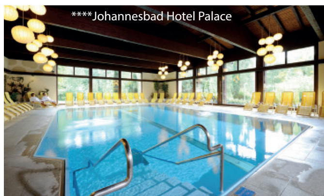
**** Johannesbad Hotel Palace