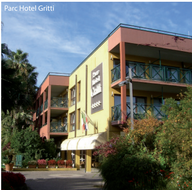
Parc Hotel Gritti

Dank des leichten spritzigen Rotweins ist das kleine Städtchen Bardolino in aller Munde. Die Altstadt mit Ihren breiten Gassen und zahlreichen Geschäften sowie eine lange Uferpromenade laden zum Bummeln ein. Hier geht es bis in die späten Abendstunden lebhaft zu. Landeinwärts von Bardolino liegen inmitten malerischer Weinberge und Olivenhaine zahlreiche Weingüter und Ölmühlen, die ihre Erzeugnisse anbieten. Der Gardasee hat zu allen Zeiten fasziniert, was den Beweis für seine unvergängliche Schönheit darstellt.