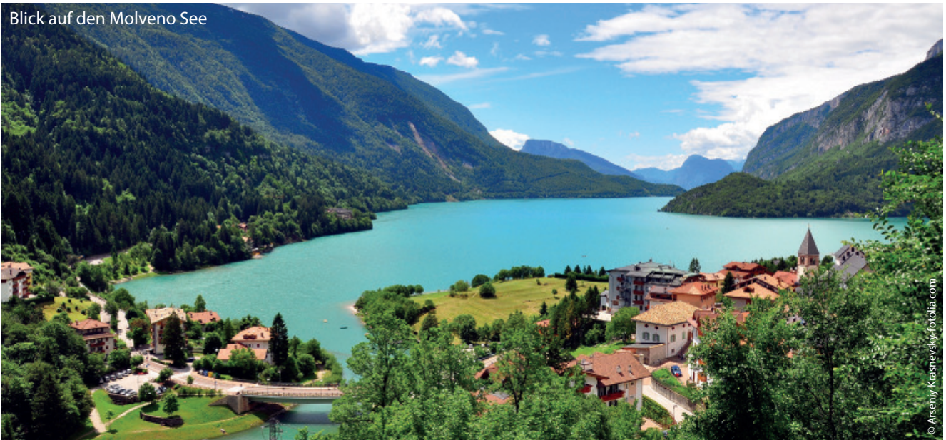
Blick auf den Molveno See

Vom Gardasee zu den Dolomiten, von der Weinlese zur Obsternte. Der Herbst im Trentino ist facettenreich. Die Lage am gleichnamigen See und zu Füßen der Brentadolomiten macht Molveno zu einem der schönsten Urlaubsorte des Trentino. Es gibt viel zu erleben und zu entdecken.