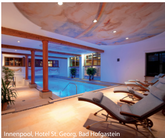
Innenpool, Hotel St. Georg, Bad Hofgastein

Das gediegene Johannesbad Hotel St. Georg befindet sich im Herzen von Bad Hofgastein. Hier genießen Sie ein exklusives Ambiente. Erholungs Momente versprechen der Wellnessbereich mit Innenpool und Fitnesscenter sowie Sauna, Dampfbad und ein Whirlpool. Gönnen Sie sich eine der zahlreichen angebotenen Wellness- und Schönheitsanwendungen. Im Restaurant werden Ihnen österreichische und internationale Küche sowie Salzburger Spezialitäten serviert.