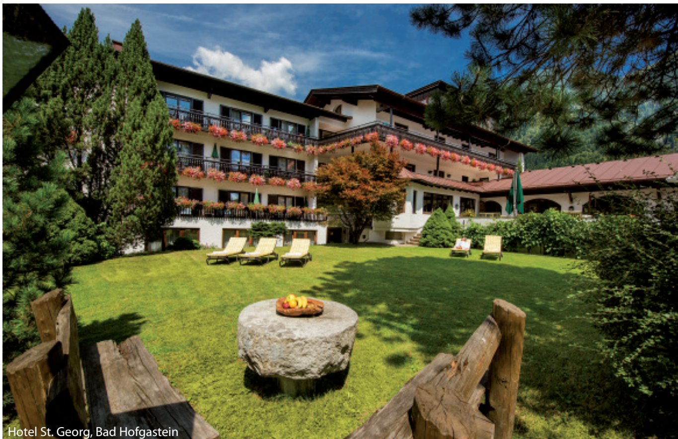
Hotel St. Georg, Bad Hofgastein

Das gediegene Johannesbad Hotel St. Georg befindet sich im Herzen von Bad Hofgastein. Hier genießen Sie ein exklusives Ambiente. Erholungs Momente versprechen der Wellnessbereich mit Innenpool und Fitnesscenter sowie Sauna, Dampfbad und ein Whirlpool. Gönnen Sie sich eine der zahlreichen angebotenen Wellness- und Schönheitsanwendungen. Im Restaurant werden Ihnen österreichische und internationale Küche sowie Salzburger Spezialitäten serviert.