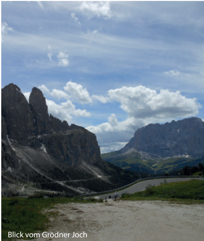
Blick vom Grödner Joch

Sonntag, 27. September - Donnerstag, 1. Oktober 2020 / 5 Tage