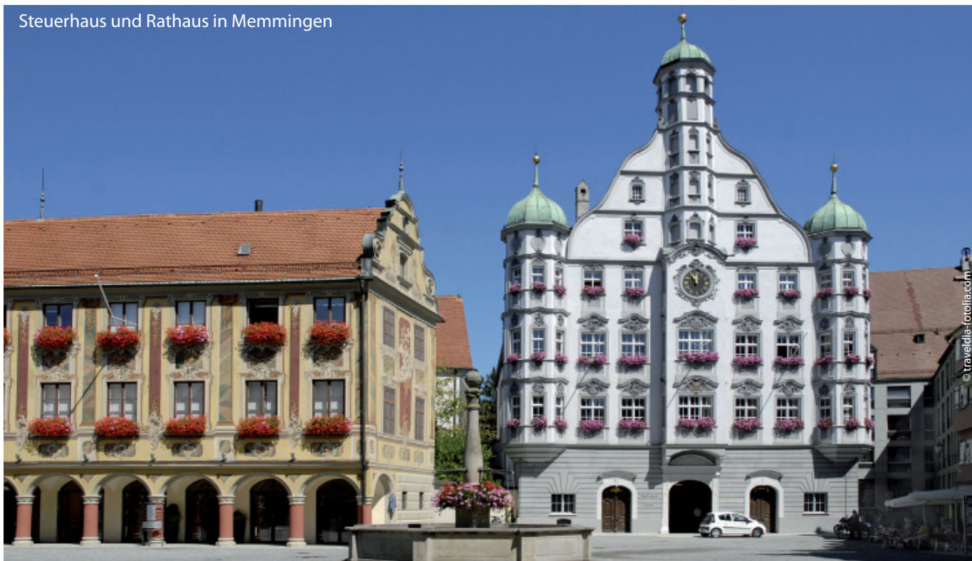
Steuerhaus und Rathaus in Memmingen

Die Stadt Memmingen verführt durch ihren mittelalterlichen Charme jeden Kulturliebhaber. Noch heute zeugen mächtige Kirchen und Klöster, barocke Fassaden von Stadtschlössern und Patrizierhäusern, aber auch malerisch verwinkelte Gassen von stolzer Stadtgeschichte. Das Allgäu fasziniert durch seine ausgewogene Mischung aus Kultur und Natur. Erfahren Sie mehr über die Geschichten des Allgäus.