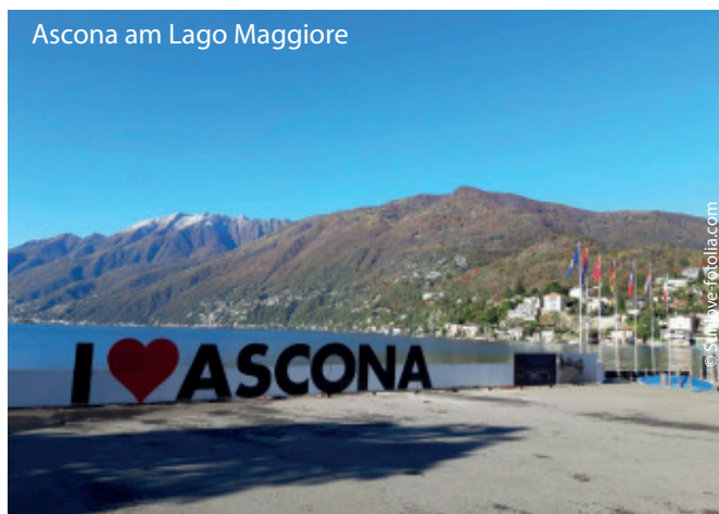
Ascona am Lago Maggiore