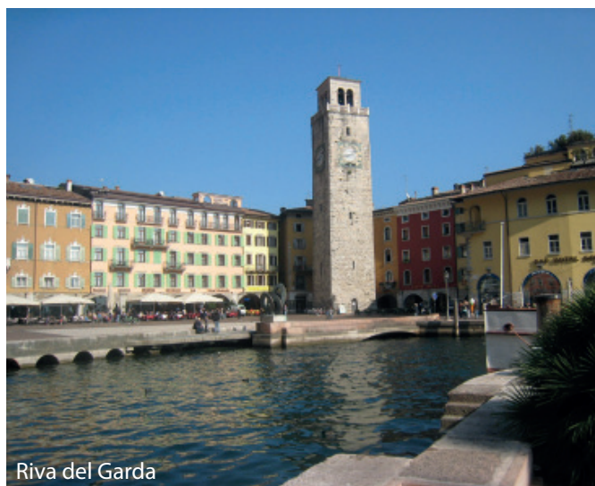
Riva del Garda

Dank des leichten spritzigen Rotweins ist das kleine Städtchen Bardolino in aller Munde. Die Altstadt mit ihren Gassen und zahlreichen Geschäften sowie eine lange Uferpromenade laden zum Bummeln ein. Hier geht es bis in die späten Abendstunden lebhaft zu und her. Landeinwärts liegen inmitten malerischer Weinberge und Olivenhaine zahlreiche Weingüter und Ölmühlen, die ihre Erzeugnisse anbieten. Das klare Wasser, die milden Temperaturen und die herrlichen Wandermöglichkeiten machen den Gardasee einfach einzigartig.