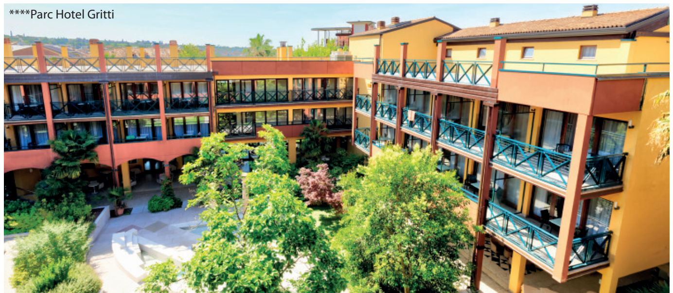
****Parc Hotel Gritti

Freitag, 7. - Dienstag, 11. Oktober 2022 / 5 Tage